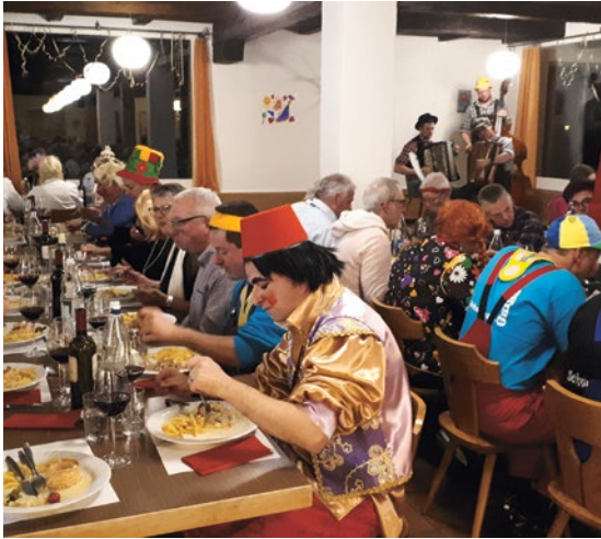
Giud und gniog

Es wurde geprosted, gegessen, gelacht, getanzt, «geServalat-brätled» bis in die frühen Morgenstunden. Der von den Guig-