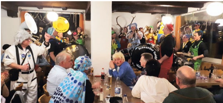
Die Schwander Guigger sorgen für Stimmung

den im Langis oben organisierten. Auch dieses Jahr unterstützte der Ski-Club Schwendi-Langis diesen Anlass, indem das Helferessen gleichzeitig durchgeführt wurde.