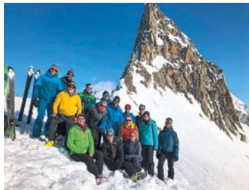
Auf dem westlichen Gerenpass

Bevor wir unser Ziel in Sichtweite hatten, mussten wir uns nochmals einer kleinen Herausforderung stellen und einen rutschigen Hang hoch fellen. So