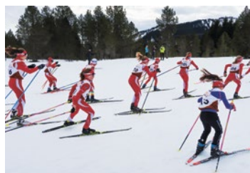
Voller Einsatz der JO

Die Clubmeisterschaften waren am Samstag nach dem Mittag angesetzt, das Wetter meinte es gut mit uns und der Regen liess bis nach der Rangverkündigung auf sich warten.