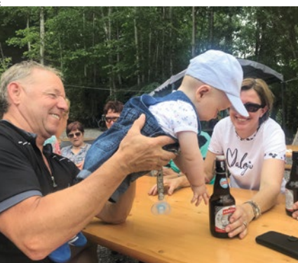
Ski-Club-Nachwuchs (mit Mütze)