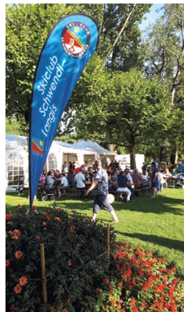
Unser gut besuchtes Ski-Club-Beizli an der 1.-August-Feier

sodass wir den Abend bei einem Zvierplättli im OW-Hof ausklingen lassen konnten. Vielen, vielen herzlichen Dank an alle Helferinnen und Helfer. Ohne euch könnten wir den Einsatz nicht leisten. Es hat sich auf alle Fälle gelohnt, gab es doch ein paar Batzeli in unsere Vereinskasse.