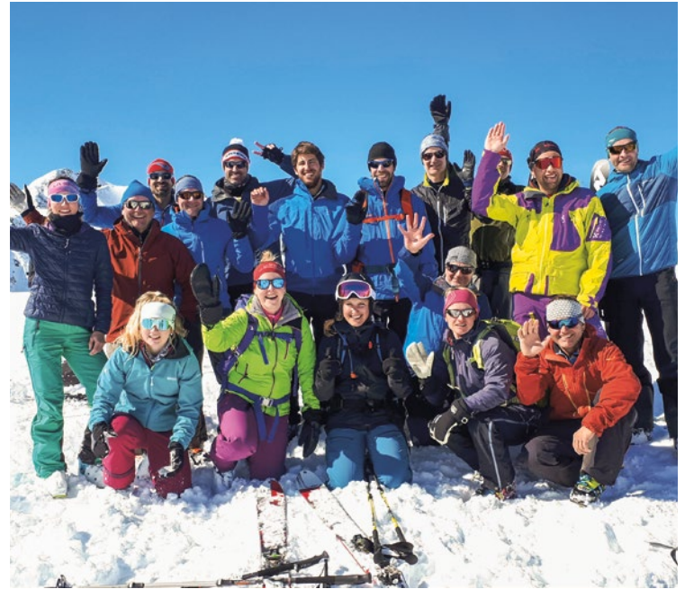
Unsere Tourengruppe auf dem Tälligrat