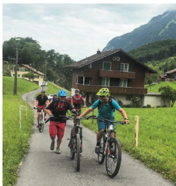
Joggen oder biken?