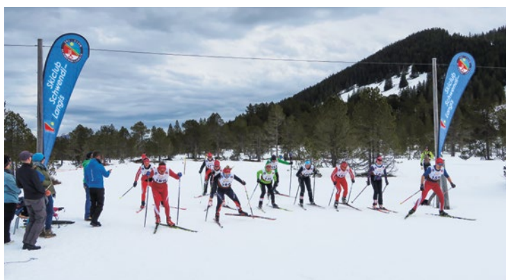
Start der «Grossen»

Am 1. Februar 2020 standen das 51. Schülerrennen sowie die 75. Clubmeisterschaften des Ski-Clubs Schwendi-Langis auf dem Programm.