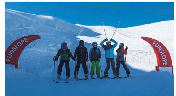
Los gehts im Funslope

Am Freitag vergnügten wir uns im Skigebiet Flims/Laax. Bei teils stockdichtem Nebel und danach wieder strahlendem Sonnenschein genossen alle die schier endlosen Skipisten und